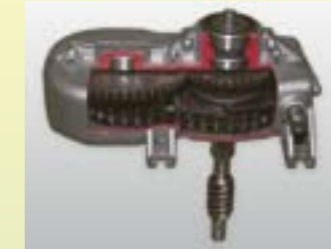
Schaltgetriebe M220 für Vor- und Rückwärtsgang