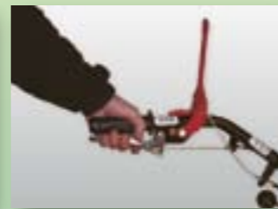
Anbaugerät: ausgeschaltet Radantrieb: eingeschaltet