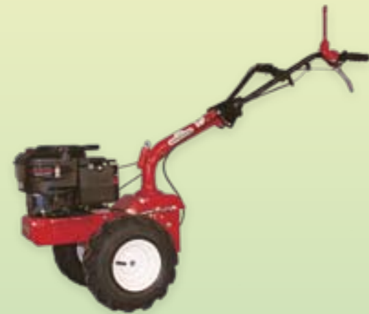
M 220 Führungsholm in gedrehter Position für Heckanbaugeräte