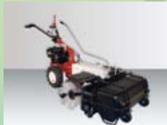
Kehren 88 cm mit Schmutz-Aufnehmern