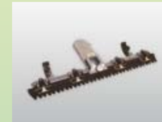
Universal-Doppelmesserbalken Schnittbreite 87 cm