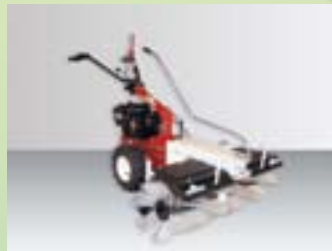
Kehren 88 cm