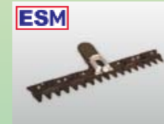
ESM Klappführungs-Doppelmesserbalken Schnittbreite 87 oder 107 cm