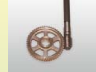
Schneckengetriebe M210/M220 für Radantrieb