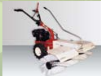
Kehren 105 cm