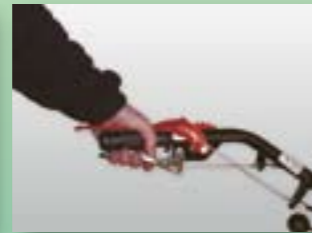
Anbaugerät: eingeschaltet Radantrieb: eingeschaltet