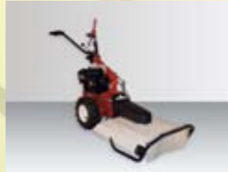
Sichelmähen (nur M220)